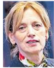
Bundesfamilienministerin Karin Prien (CDU)

inzwischen sehr unterschiedlich gelebt, in Deutschland, aber auch in anderen Ländern. Es gibt nicht mehr das allgemeingültige Familienbild.“ Sie fügte zugleich hinzu: „Vorlesen war und ist ein Thema, das stark vom Bildungshintergrund und der eigenen Vorlese-Erfahrung abhängt.“ In Haushalten mit geringerer Bildung, aber aufgrund chronischen Zeitmangels durchaus auch in bildungshöheren gesellschaftlichen Milieus, gebe es ganz sicher das Phänomen, Kinder zur eigenen Entlastung am digitalen Endgerät zu parken. „Manche Kinder verein-