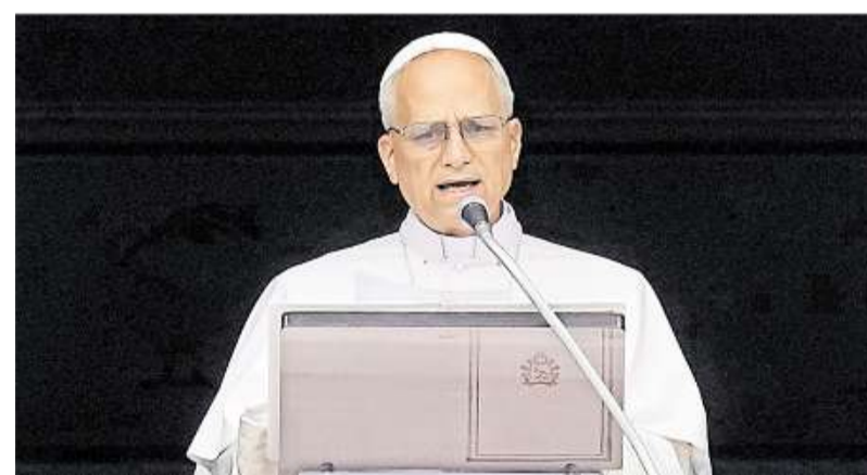
Papst Leo XIV. spricht sich entschieden gegen die Vertuschung von Missbrauchsfällen in der katholischen Kirche aus.