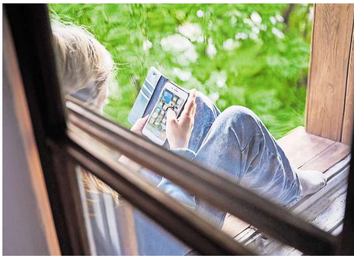
Viele Kinder verbringen ihre Freizeit allein mit dem Smartphone. Fehlen echte Gespräche, Bewegung und Zuwendung, kann das ihre soziale und emotionale Entwicklung beeinträchtigen.

Andere Familien hätten wiederum die Freizeit der Kinder komplett mit Aktivitäten durchorganisiert. „Dann gibt es den Trend in jungen, progressiven Milieus, ganz besonders viel Zeit mit den Kindern zu verbringen.“ Da gebe es trotz fortgeschrittener Stunde auch mal lange Vorlese-Sessions, wenn es gerade spannend sei und es würden gemeinsam die kleinen Wunder des Alltags entdeckt – auch um sich selbst zu finden. „Hier könnte man auch die Frage stellen: Ist das nicht übertrieben?“