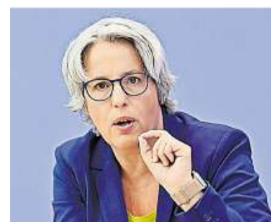
Die Bundesbeauftragte gegen Sexuellen Missbrauch von Kindern und Jugendlichen, Kerstin Claus, kämpft für den Fonds, aus dem Opfer entschädigt werden sollen.

auf unbürokratische und niedrigschwellige Hilfe“. Die Mittel müssten deshalb „dauerhaft gesichert und der Fonds muss perspektivisch