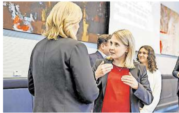
Arbeitsministerin Baerbel Bas (SPD) und Bauministerin Verena Hubertz (SPD, rechts) im Gespräch vor der Fraktionssitzung.

Der Bau-Turbo sieht einige Regelungen vor, um schnell mehr Wohn-