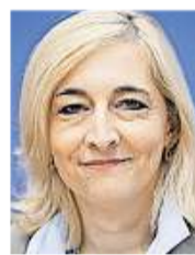
Die Änderungen von Bundesgesundheitsministerin Nina Warken (CDU) gefallen nicht allen.

BERLIN (kna) Die Bundesregierung hat nach langem Tauziehen eine Reform der Krankenhausreform auf den Weg gebracht. Das Kabinett stimmte am Mittwoch den von Bundesgesundheitsministerin Nina Warken (CDU) vorgelegten Veränderungen der 2024 von der Ampel-Regierung verabschiedeten Krankenhausreform zu. Warken