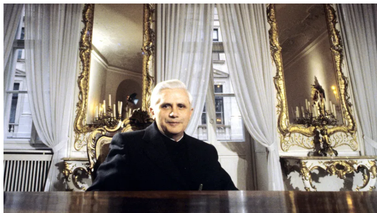
Joseph Ratzinger als Erzbischof von München und Freising, 1980. Da war er 53 Jahre alt.