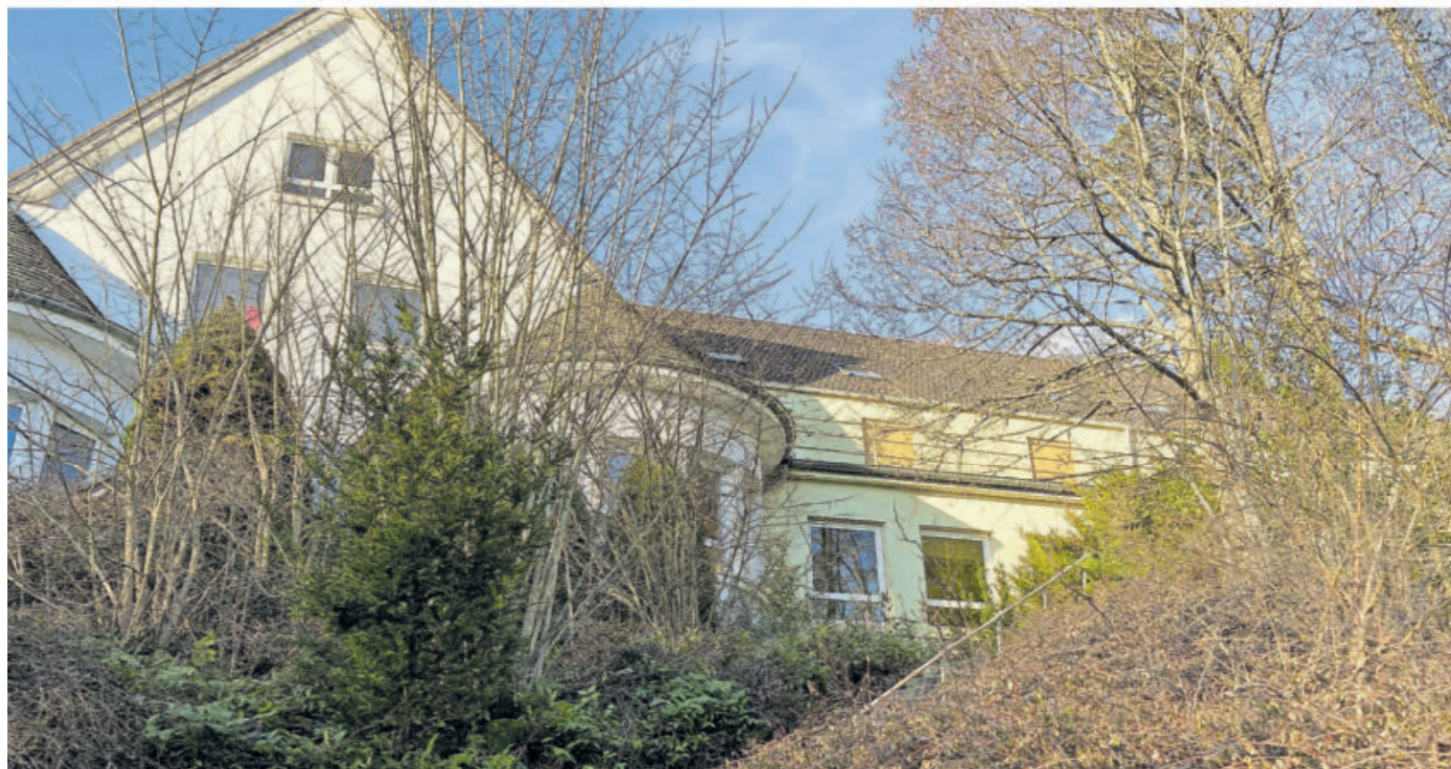
Schauplatz von Gewalt und Missbrauch: das Albertinum in Gerolstein, früher kirchliche Erziehungsanstalt, steht seit einigen Jahren leer.

„Zu den Beschuldigten der körperlichen und psychischen Gewalt zählen einerseits alle drei langjährig als Direktoren tätigen Priester und neun Mitarbeiter“, heißt es in dem Bericht. Die Direktoren und ein langjähriger Mitarbeiter sollen Schülern auch sexuelle Gewalt angetan haben. Ebenso werden wiederum Mitschüler, „vornehmlich ältere Jungen und Subpräferken“, beschuldigt, alle Formen der Gewalt ausgeübt zu haben. Ein ehemaliger